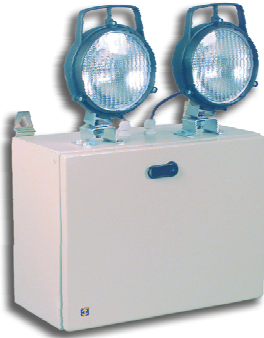
Abbildung Typ HS